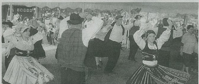
O rancho folclórico do Cranston Portuguese Club foi um dos que se exibiu no parque da Pedra de Dighton.