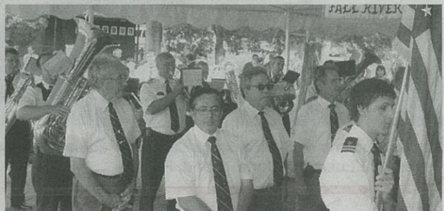
A Banda de Santo António, de Fall River, brilhou uma tarde cultural em Dighton.