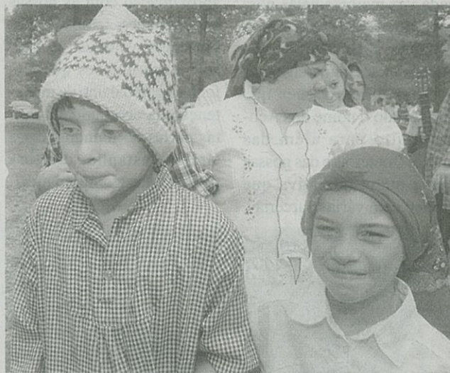
Dois jovens do rancho folclórico da Sociedade Cultural Açoriana, de Fall River, um dos que abrilhantou a tarde cultural levada a efeito no parque da Pedra de Dighton no passado sábado.