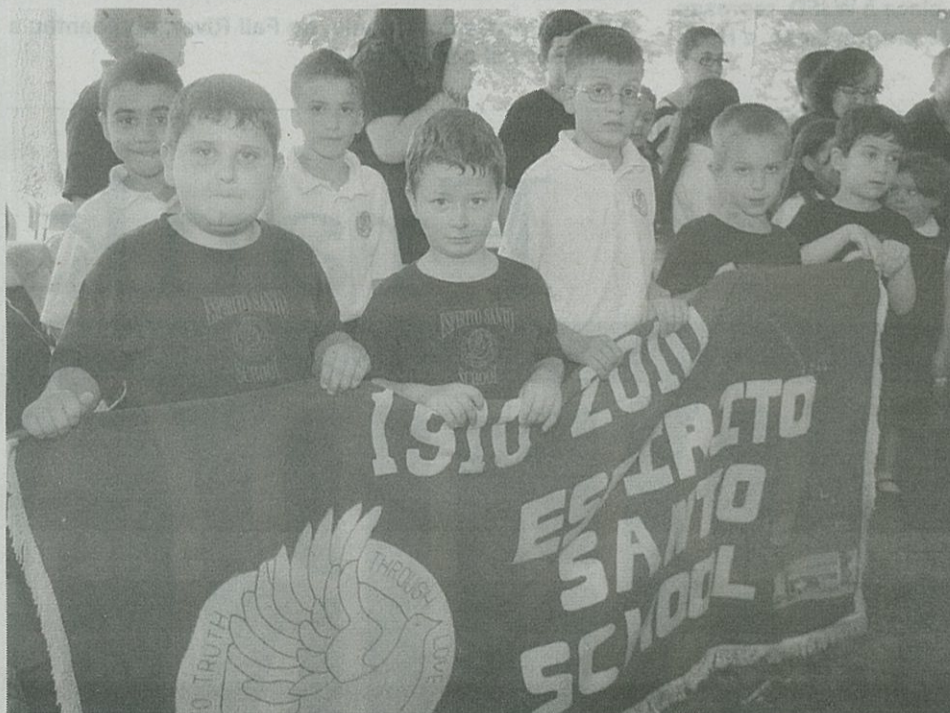
Alunos da centenária escola do Espírito Santo, de Fall River.